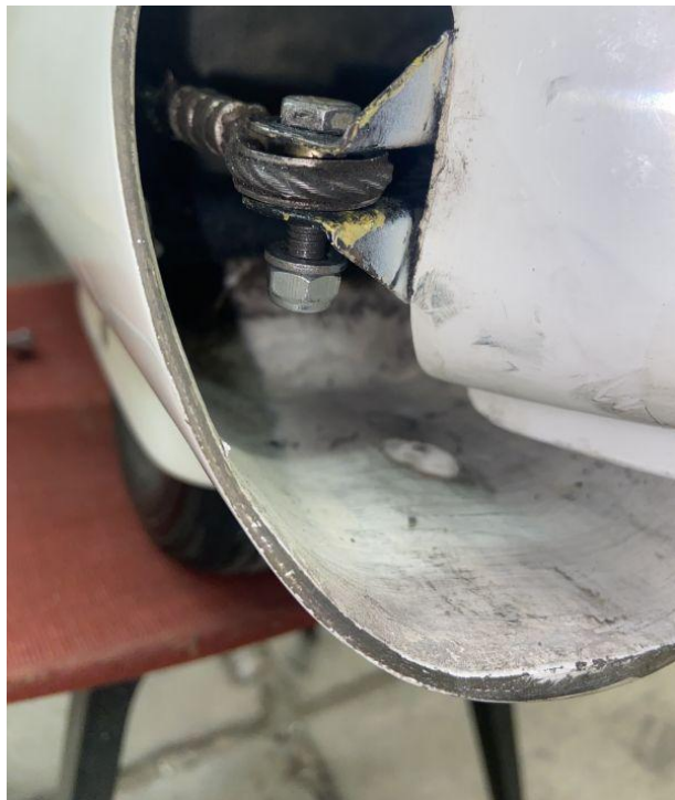
Figuur 8. (linker) Voetenstuurkabel bevestiging aan richtingsroer